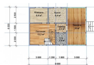
План 2-го этажа